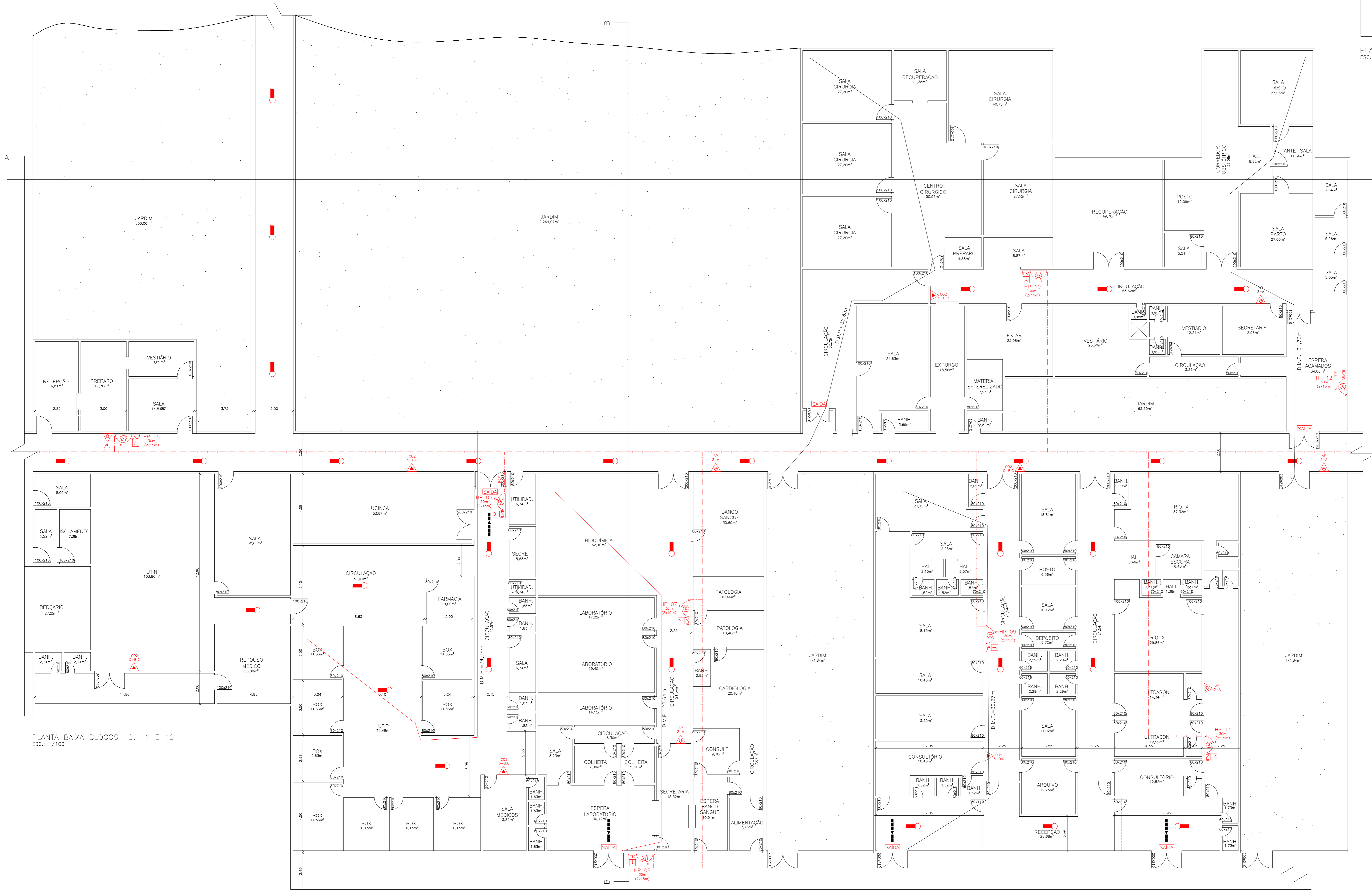
PLANTA BAIXA BLOCOS 10, 11 E 12 ESC.: 1/100